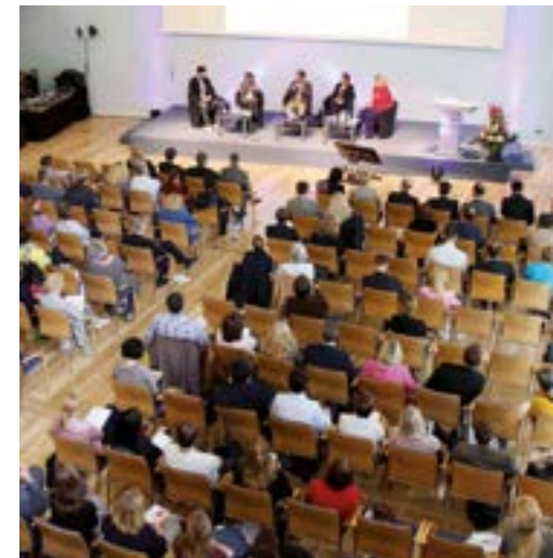
IHKs informieren ausführlich zur betrieblichen Gesundheitsförderung – wie hier die IHK für München und Oberbayern.